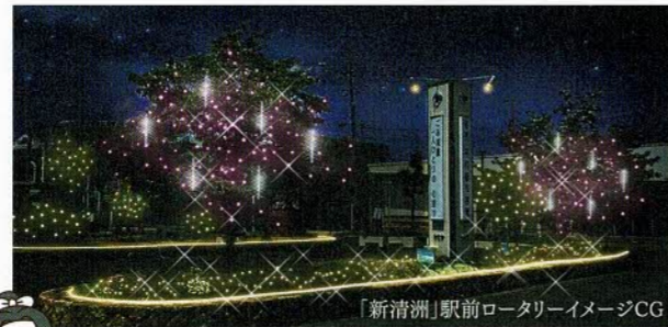
「新清洲」駅前ロータリーイメージCG

清洲城遊歩道・清洲古城跡公園周辺におけるイルミネーションエリアの拡大に加え、名鉄「新清洲」駅前ロータリー(西口側)でもイルミネーションを展開します!!